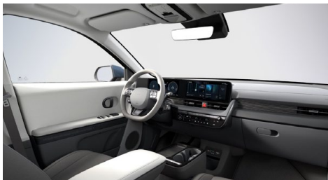
Šedý interiér – látkové čalounění sedadel – dostupné pro Smart, Style