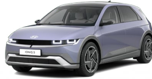
Meta Blue Metalická Cena: 19 900 Kč Nelze pro N Line