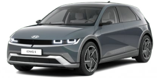
Digital Teal-Green Perleťová Cena: 19 900 Kč Nelze pro N Line