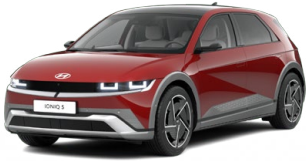
Ultimate Red Metalická Cena: 0 Kč