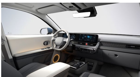
Šedý interiér – čalounění sedadel kůže-látka – dostupné pro Style na přání