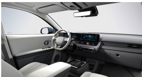
Šedý interiér – kožené čalounění sedadel – výhradně pro Style Premium