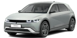
Celadon Gray Matná metalická Cena: 24 900 Kč Nelze pro N Line Dostupné později