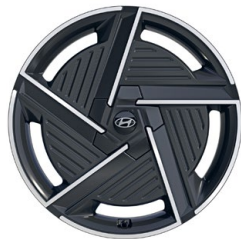
20" kola z lehké slitiny