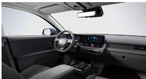
Černý interiér – kožené čalounění sedadel – výhradně pro Style Premium