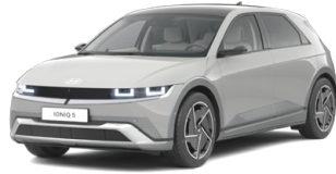
Cyber Gray Metalická Cena: 19 900 Kč