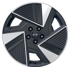
19" kola z lehké slitiny