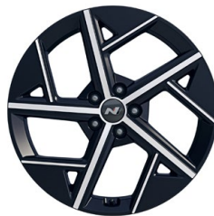
20" kola z lehké slitiny N Line

www.porovnejhyundai.cz (Porovnejte si vozy Hyundai s konkurencí)