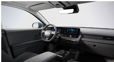
Černý interiér – látkové čalounění sedadel – dostupné pro Smart, Style