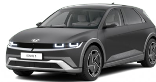
Ecotronic Gray Matná metalická Cena: 24 900 Kč