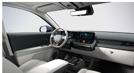
Šedo zelený interiér – kožené čalounění sedadel – výhradně pro Style Premium