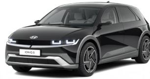
Abbys Black Pearl Perleťová Cena: 19 900 Kč