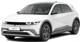
Atlas White Matná metalická Cena: 24 900 Kč