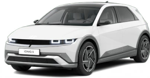
Atlas White Speciální pastelová Cena: 11 900 Kč