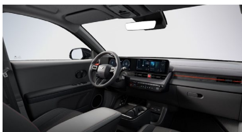
N Line interiér – čalounění sedadel kůže-látka – výhradně pro N Line Style