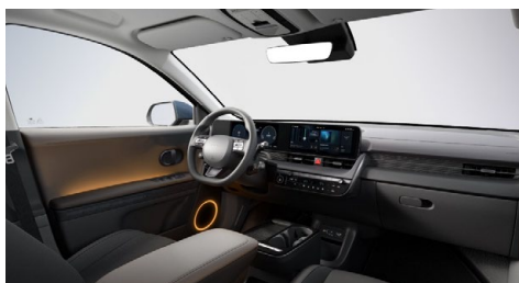
Černý interiér – čalounění sedadel kůže-látka – dostupné pro Style na přání