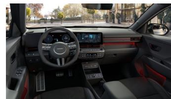
Černý interiér N Line Premium – čalounění sedadel kůže/semiš – výhradně pro N Line Premium

www.porovnejhyundai.cz (Porovnejte si vozy Hyundai s konkurencí)