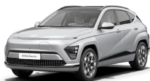
Shimmering Silver Metalická Kombinace s černým lakováním střechy Cena: 17 900 Kč