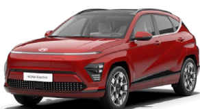
Ultimate Red Metalická Kombinace s černým lakováním střechy Cena: 17 900 Kč