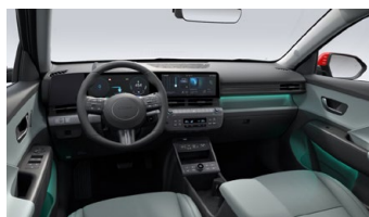
Šalvějově zelený interiér – kožené čalounění sedadel – výhradně pro Style Premium