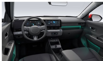
Černý interiér – čalounění sedadel kůže/látka – výhradně pro Style