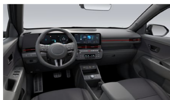
Černý interiér N Line – látkové čalounění sedadel – výhradně pro N Line