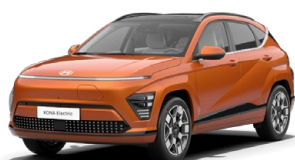
Jupiter Orange Metalická Kombinace s černým lakováním střechy Cena: 17 900 Kč