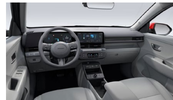
Šedý interiér – látkové čalounění sedadel – dostupné pro Smart, Czech edition