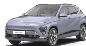
Meta Blue Pearl Metalická Kombinace s černým lakováním střechy Cena: 17 900 Kč