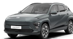
Cypress Green Perleťová Kombinace s černým lakováním střechy Cena: 17 900 Kč