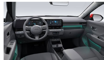
Eco interiér – čalounění sedadel kůže/semiš – výhradně pro Style