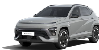
Shadow Grey Speciální pastelová Kombinace s černým lakováním střechy Cena: 17 900 Kč Pouze pro N Line