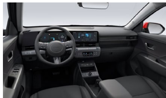
Černý interiér – látkové čalounění sedadel – dostupné pro Smart, Czech edition