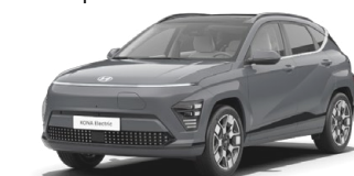
Ecotronic Gray Perleťová Kombinace s černým lakováním střechy Cena: 17 900 Kč