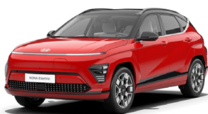
Engine Red Pastelová Kombinace s černým lakováním střechy Cena: 0 Kč