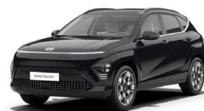
Abbyss Black Pearl Perleťová Cena: 17 900 Kč