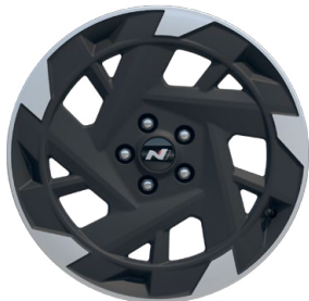
19" kola z lehké slitiny N Line