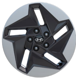
17" kola z lehké slitiny