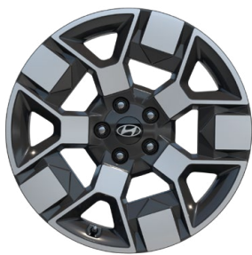
19" kola z lehké slitiny