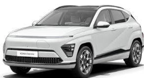
Serenity White Perleťová Kombinace s černým lakováním střechy Cena: 17 900 Kč