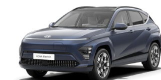
Sailing Blue Perleťová Kombinace s černým lakováním střechy Cena: 17 900 Kč