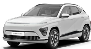
Atlas White Speciální pastelová Kombinace s černým lakováním střechy Cena: 10 000 Kč